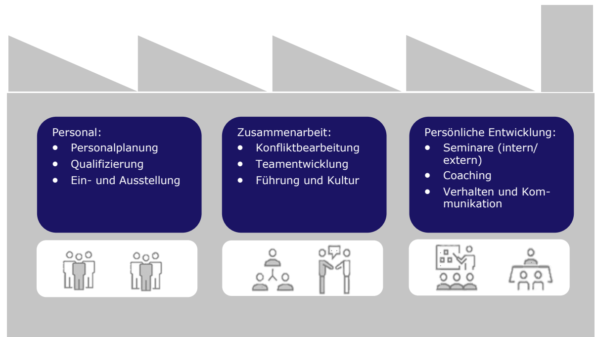
Abb.: Unsere Leistungen für Sie im Überblick